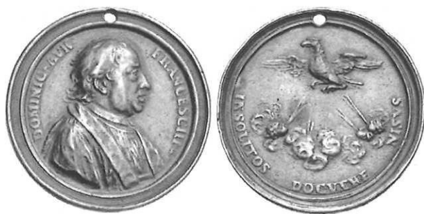
Fig. 3: Medaglia encomiativa raffigurante don Domenico Aurelio Franceschi rettore della Parrocchia di S. Lorenzo in Reggio – Fusione in bronzo, Firenze 1760. (Collezione privata)

Fu quindi un'iniziativa dal basso che nell'archivio parrocchiale è ben documentata e che ben chiarisce